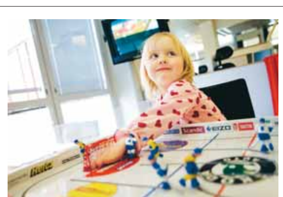
Engla, 3, lirar lite hockey. I bakgrunden är det Boli-bompa på tv:n.

Mejla: insandare.stockholm@direktpress.se SMS: 0730-120 830